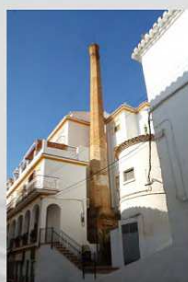
BENEYTO Y PERIS Casarabonela